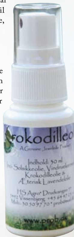
Krokodilleolie udvundet af krokodillens fedt kan hjælpe på muk, flænger og andre hudproblemer hos heste.

Charlotte Pechüle fra HS Agro (dem der i forvejen har Prob Ekholm) har fået Jewel Niles krokodilleolie i handlen. – Vi har kun haft olien i vores hænder i ganske kort tid, men hesteverdenen har allerede taget fint imod produktet, der i øvrigt også fint kan bruges på an-